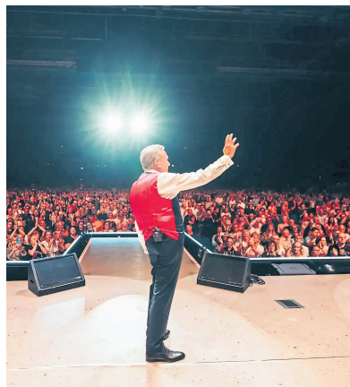
Roland Kaiser freut sich schon auf seine nächste Arena-Tour.

Wer Kaiser 2027 kurz vor seinem großen Geburtstag live sehen möchte, sollte sich ein Datum im Kalender notieren: Am 24. April um 12 Uhr mittags beginnt der allgemeine Vorverkaufsstart. Eventim-Presale ist exakt zwei Tage vorher. Und mit ganz viel Glück kann man dem Kaiser dann vielleicht sogar ein paar Geburtstagsblumen auf die Bühne werfen.